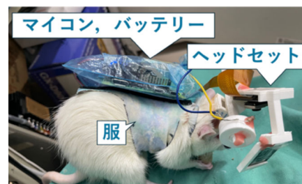
Fig. 1. Free moving rat with the system

本研究は、自由行動ラットのワイヤレス瞳孔径計測システムを構築した。構築したシステムを用いて、自由行動ラットの音刺激に対する瞳孔径を計測した。その結果、撮影時間の半分以上で瞳孔を検出することができた。また、音開始2秒後から7秒後まで30%ほど瞳孔が拡大する傾向を確認できた。交流時のラットの瞳孔径を計測し、ラットの交流での本システムの可用性を確認できた。今後、ラットの交流時の瞳孔径を調べる上で、本システムは非常に有用である。